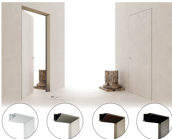
Brut avec primaire Bronze clair Bronze foncé Bronze graphite